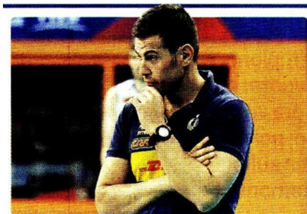
Gianlorenzo Blengini, 47 anni, ct della Nazionale maschile GALBIATI